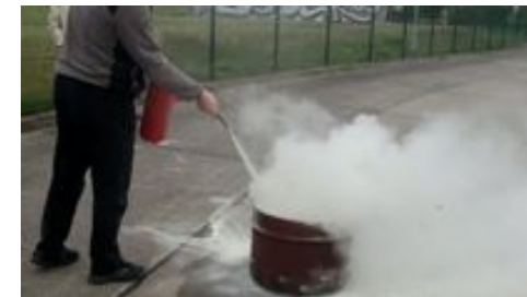
Training im Außenobjekt

Personalvermittlungen sind Bestandteil unseres Leistungsangebotes. Eine Vermittlungshilfe durch „ ISG-Personaldienstleistungen “ kann in Anspruch genommen werden.