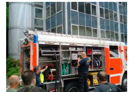
Brandschutzausbildung mit „schwerer Technik“

Personalvermittlungen sind Bestandteil unseres Leistungsangebotes. Eine Vermittlungshilfe durch „ ISG-Personaldienstleistungen “ kann über 6 Monate kostenfrei in Anspruch genommen werden.