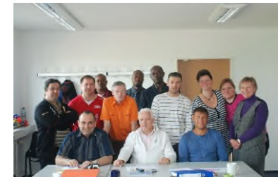
Erfolgreicher Kurs mit Deutsch-Modulen und 90% bestandene IHK-Prüfung

Die Deutsch-Module können auch als Vorbereitung auf die Umschulungen zur „Fachkraft für Schutz und Sicherheit“ oder andere Sicherheitsausbildungen ohne IHK-Sachkundeprüfung absolviert werden. Sie sind einzeln nach AZAV-zugelassen. Wir beraten Sie gern.