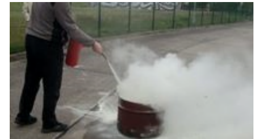
Training im Außenobjekt

Personalvermittlungen sind Bestandteil unseres Leistungsangebotes. Eine Vermittlungshilfe durch „ ISG-Personaldienstleistungen “ kann in Anspruch genommen werden.